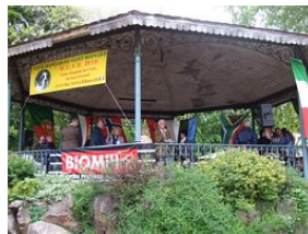
Panorâmica geral do recinto da Exposição e da Cerimónia de Abertura