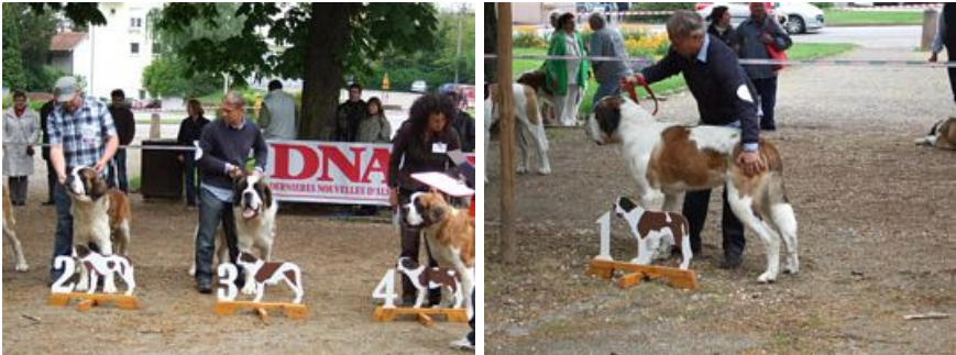
Z 'Elliot e Zeal do Ferrador