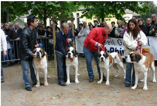
Grupo de Criador Ferrador